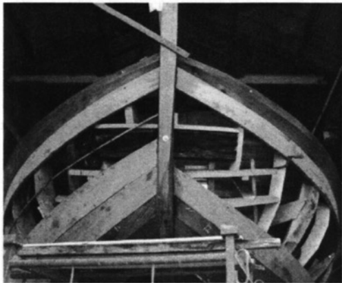
Nieuwe voorsteven, huidgangen en berghout, juni 2005

Volgens de huidige planning gaat het 25 ton zware schip half augustus per oplegger naar Makkum.